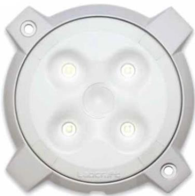
MEGALUX RECESSED (PD2)